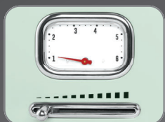
6 Browning temperature setting