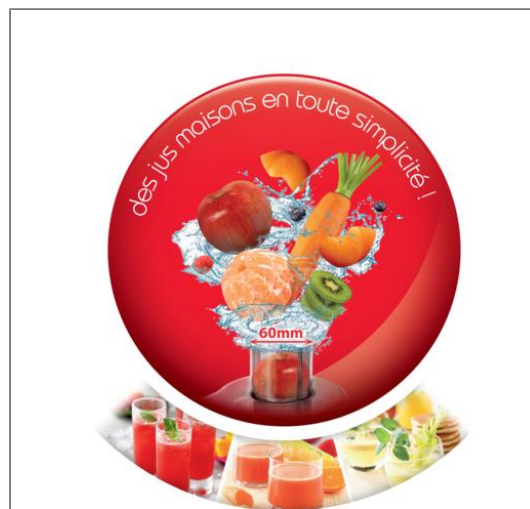
FRUTELIA PLUS MÉTAL MOULINEX 400 W CENTRIFUGEUSE JU420D10