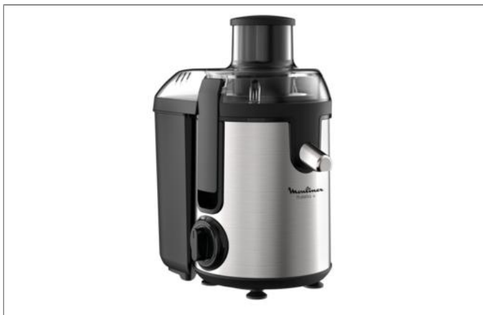
frutelia ─ centrifugal