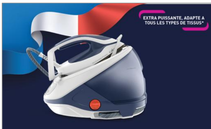
Pro Express Protect 7,5 Bars Bleue Centrale Vapeur GV9224C1